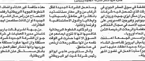
خطوطها شعار الشركة الجديدة

والتنظيم والسياسية يقول رشادوي في اسيا. وقال طيب ان هذه الشركات تبحث عن وكلاء تسويق بالشرق الاوسط من مكانة تعرض على التسوي في اسيا.